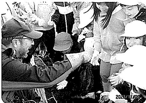
【七戸小学校 サツマイモ堀の様子】

児童・生徒の皆様に、ボランティアや社会福祉へ理解と関心をもっていただくことを目的に、七戸町内の小学校、中学校、高等学校、特別支援学校、専修学校を対象とし、学校内外でのボランティア活動、福祉体験学習や地域交流に対して助成金を交付しています。