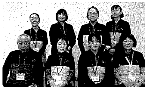
訪問介護事業所（ヘルパー）スタッフ

自宅での生活や介護のこと等、お困りのことがありましたら、お気軽にお声をかけてください。お電話でのご相談にも対応しています。介護職員（常勤・パート）も随時募集しておりますので、お気軽にお問い合わせください。