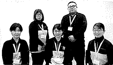
居宅介護支援事業所（ケアマネージャー）スタッフ

お気軽にご相談ください！【居宅介護支援事業所専門 ☎ 0176-62-4419】