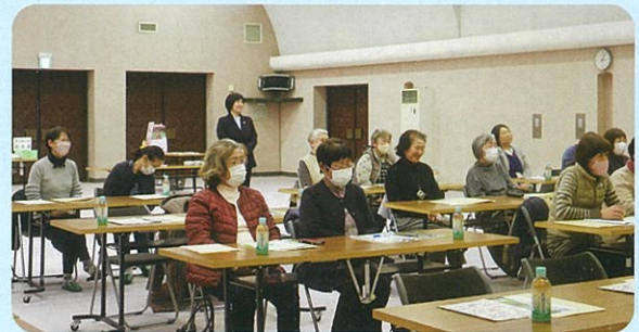
【講話「青森県内特殊詐欺等被害状況について」の様子】

参加者からは、「悪徳商法の手口や認知症など専門的な知識を学びたいと思いました」、「勉強になりました」、「定期的実施してほしいです」などの声がありました。