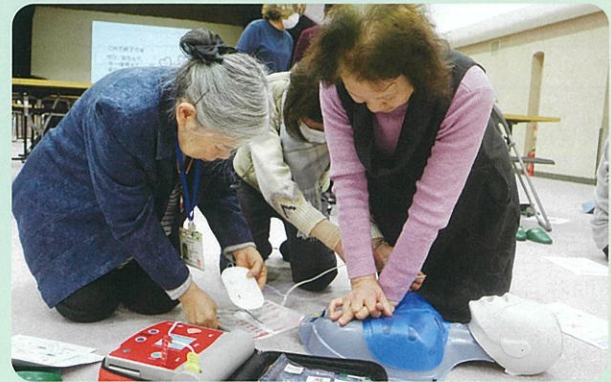
【心肺蘇生とAEDの使い方についての実技の様子】