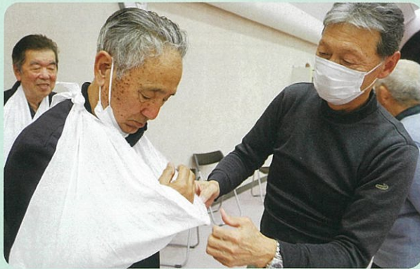
【三角巾を使った傷の手当についての実技の様子】

参加者からは、「昨年度も受講しましたが、忘れてしまっているので、繰り返しが必要と思いました」、「実技もあって勉強になりました」などの声があり、防災・減災意識の向上につながりました。