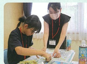
子ども福祉体験スクール2024 押し花体験の様子