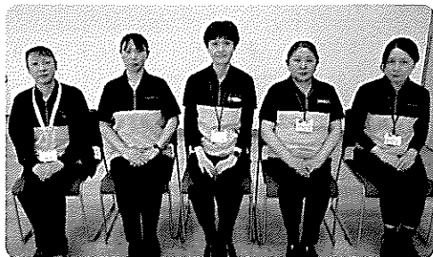
訪問介護支援事業所（管理者・責任者・事務）スタッフ