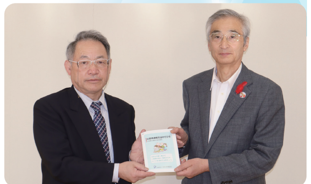
“災害時連絡方法のてびき” 寄贈の様子

日本公衆電話会より災害時連絡方法のてびきを寄贈いただきました! 11月28日(月)に、公益財団法人日本公衆電話会より、「1711災害時連絡方法のてびき」を200部寄贈いただきました。1711災害時連絡方法のてびきは、災害時に家族などの安否等の情報を音声で録音、確認できるサービスです。 今後、町内の要援護者やその見守り・支援を行っている方々に、訪問時や研修会等で配布し説明をするなど、本会の事業等で活用する予定です。 さて、本会では、七戸町地域防災計画に位置づけられた「七戸町災害ボランティアセンター」を運営するために必要な事項を定め、災害ボランティアセンターとして活動するための準備をしております。 災害ボランティアセンターは、災害時にボランティアと被災者のニーズをつなぎ、生活の復旧・復興に向けてボランティアの拠点となります。また、七戸町で災害が発生した際に、ボランティア活動がしたいとお考えの皆様は、本会にお問い合わせください。災害発生時には、ボランティア活動をしてほしいという希望も随時受け付けます! 【担当/小笠原】