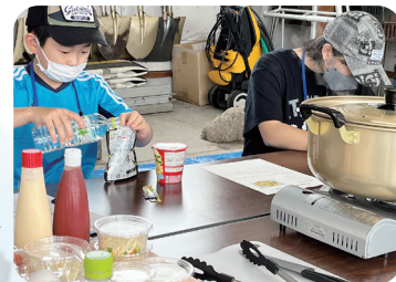
子ども福祉 体験スクール 2022の様子▶