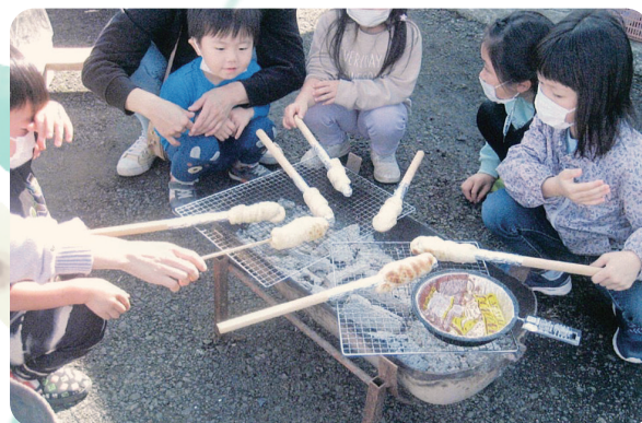
大沢町内会ほのぼのの交流会活動の様子