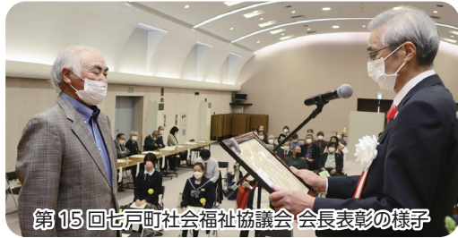
第15回七戸町社会福祉協議会会長表彰の様子